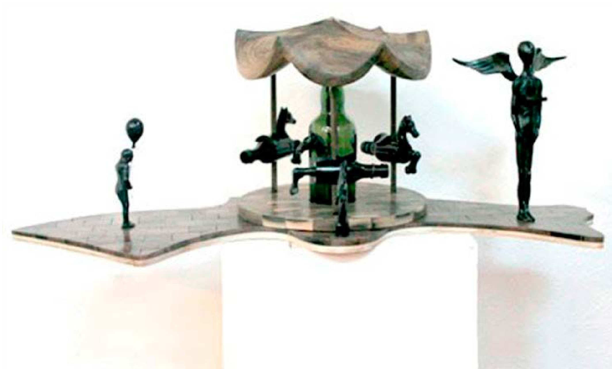
Imagen de evento anterior